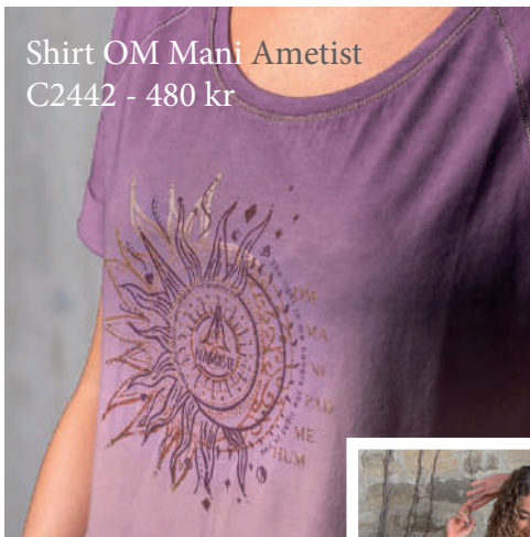
Shirt OM Mani Ametist C2442 - 480 kr