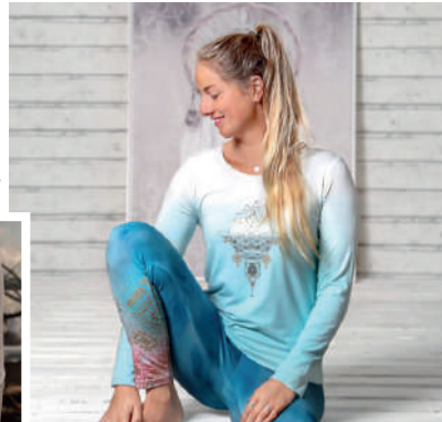
Shirt Long Sleeve Shakti Blue breeze/White E2556 572 kr