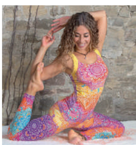
Yoga Leggings Rainbow N1778 572 kr