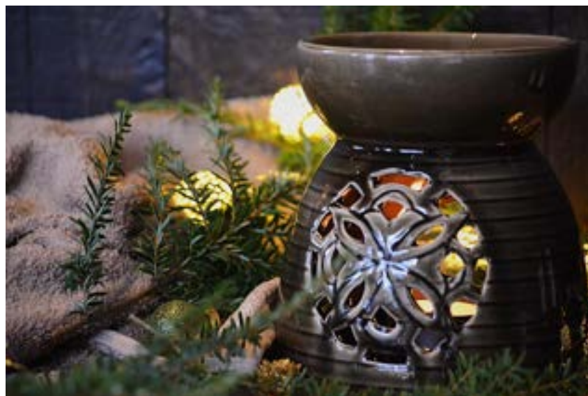
Aromalampa tagethe grey 199 kr

Tips vid jul för att sprida julstämning, använd t ex aromblandning Julmys eller Kryddstämning.